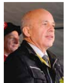
Festredner Bundesrat Ueli Maurer.

So ein Jubiläum wie heute stimmt feierlich. Vielleicht geht es Ihnen auch so: Wir blicken zurück und werden uns bewusst, dass wir in einer langen Abfolge stehen. In einer Reihe von Generationen, die viel Gemeinsames haben. Wir fühlen uns Menschen nahe, die vor uns gelebt haben oder die nach uns leben werden; Menschen also, die wir nicht persönlich kennen, mit denen wir aber Ideale und Werte teilen. Man spürt Tradition. Man spürt Geschichte. Man spürt Verbundenheit über die Zeit hinweg. Seit 75 Jahren gibt es das Pistolen-Rütli-schiessen. Seit 150 Jahren gibt es das 300-Meter-Rütli-schiessen. Und seit 721 Jahren gibt es die Schweiz. Wir sind nicht die Ersten. Wir setzen fort, was