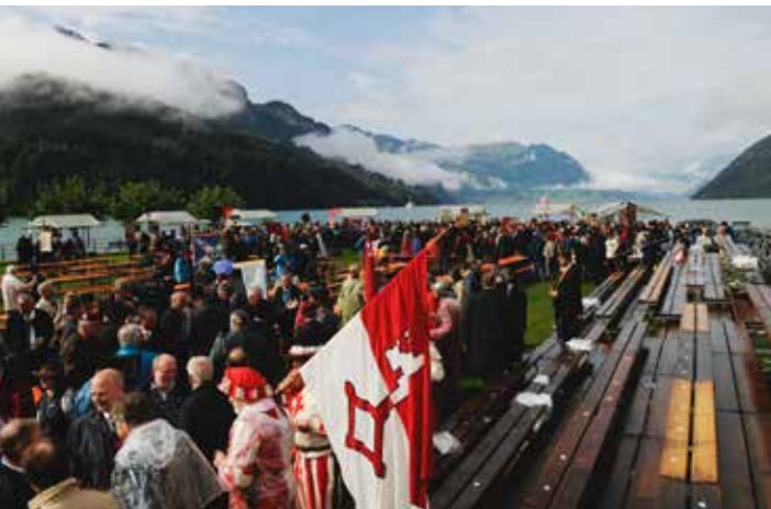
Während des Volksapéros in Brunnen zeigte sich die Sonne.