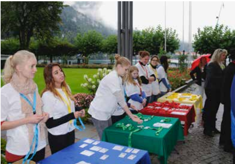
Abgabe der nach Farben geordneten Unterlagen an Ehrengäste in Brunnen.

Alle Ehrengäste wurden von den Waldstätterpräsidenten und dem OK des Pistolen-schiessens begrüsst und herzlich willkommen geheissen.