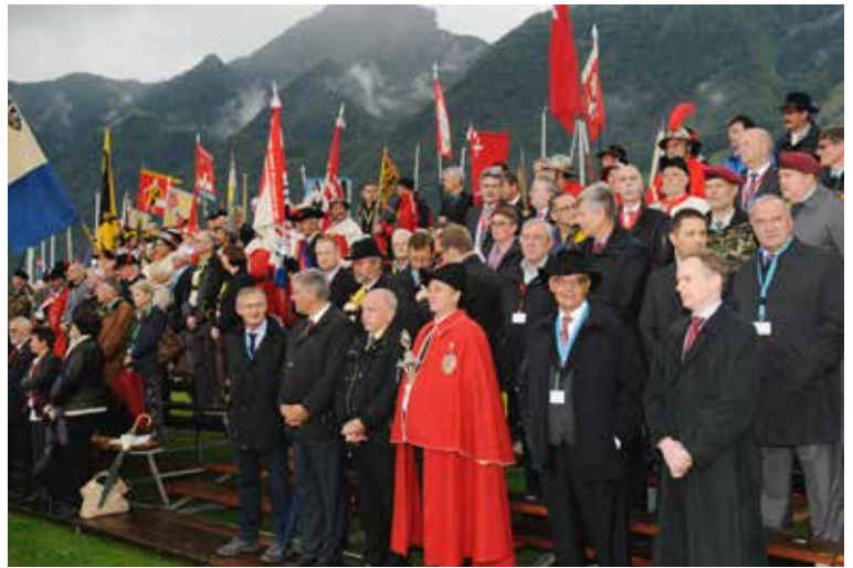
Die Tribüne der Ehrengäste während dem Festgottesdienst.