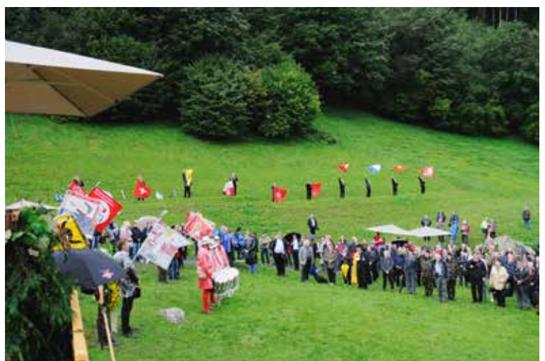
Stimmungsbild vom Rütli.

«Heute am Mittwoch vor Sankt Martinstag begehen wir zum 100-Mal das Rütli-schiessen, den Ehrentag friedlicher Einsatzbereitschaft für unser Vaterland und seine höchsten Güter. Kein kriegerischer Schuss hat je das Rütli entweiht. Es soll auch fürderhin kein anderer Schuss als der des freundeidgenössischen Wettkampfes die Stätte der Freiheit und Friedens versehen: das sei der Rütli-schützen Fahneid.»